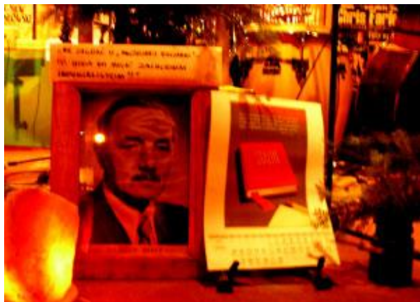
Arcyksiążę Ferdynand i gospodarz witają sylwestrowiczów.